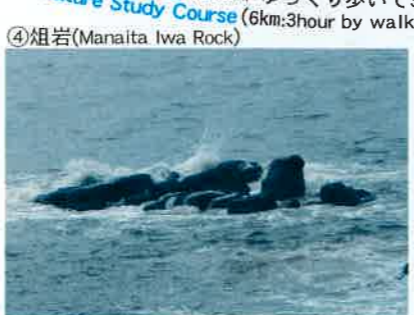
④焔岩(Manaita Iwa Rock)