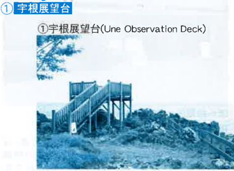
①宇根展望台(Ue no Sengen Observation Deck)

伊東市門脇駐車場(有料) ●住所 伊東市富戸842-242 ●電話 夜間・救急 0557-45-4226 ●時間 24時間営業 ●対応車種 乗用車 マイクロバス ※二輪車・自転車無料 ●駐車台数 乗用車(123台) マイクロバス(3台) ●駐車料金 1台500円