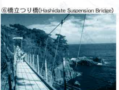
⑥橋立つり橋(Hashidate Suspension Bridge)