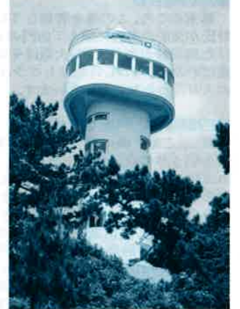
②門脇岬灯台(Kadowaki Cape Light House)