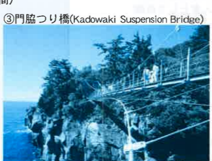
③門脇つり橋(Kadowaki Suspension Bridge)

伊豆シャボテン動物公園 さくらの里・大室山 To IZU SHABOTEN ZOO Sakura no Sato Mt. Omuro