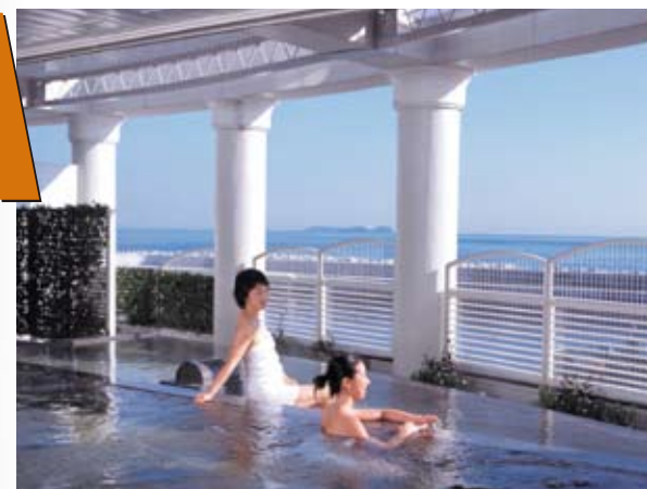
■シーサイドスパ (地図 P29・30 B-2 ☎0557-38-1811)