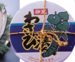
■Pickled Japanese horseradish