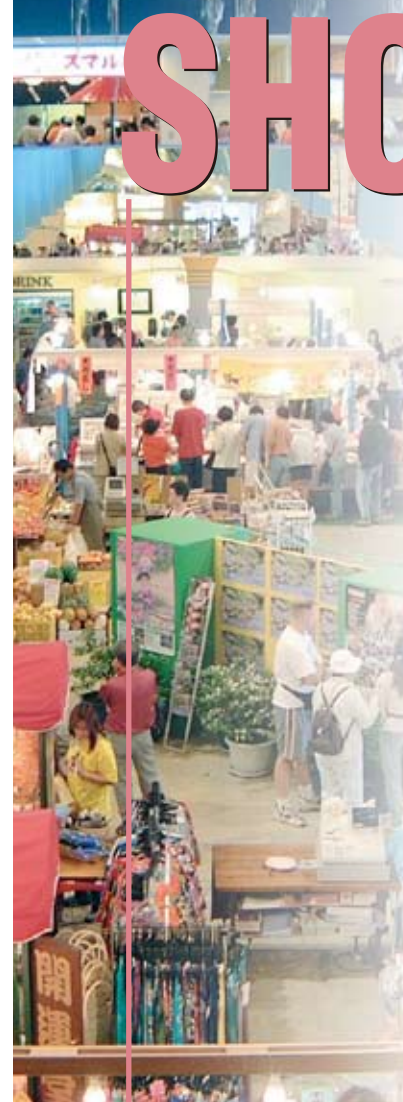
■ファーマーズマーケット「いで湯っこ市場」(地図 P29・30 C-3 ☎0557-44-5050)