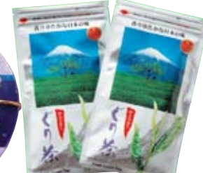
■Chestnut teaan ultra-pr