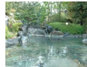
■Kogen no Yu (Map pp.29・30, E-2 ☎0557-54-5200)