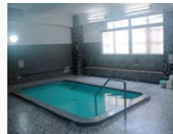
■Shichifukuji no Yu