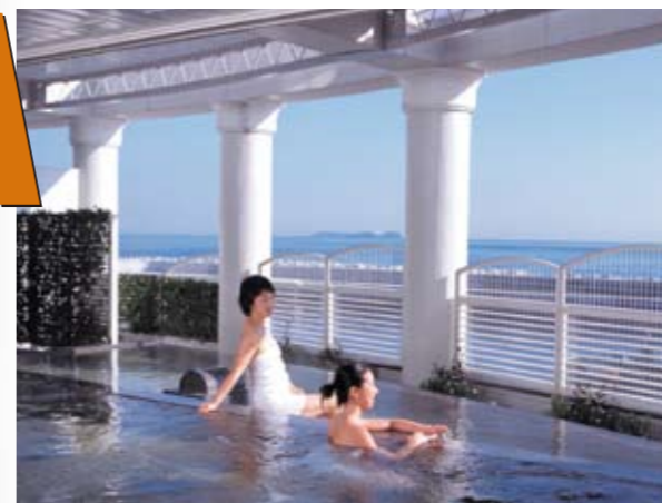
■シーサイドスパ (地図 P29・30 B-2 ☎0557-38-1811)