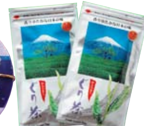
■Chestnut teaan ultra-pr