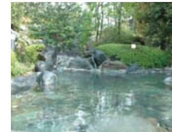
■Kogen no Yu (Map pp.29・30, E-2) ☎0557-54-5200