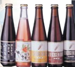
■Locally brewed beer