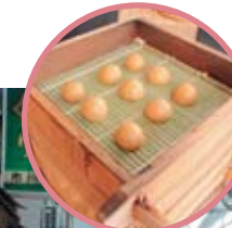
■温泉まんじゅう ■Spa manju